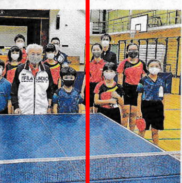
篠木卓球スポーツ少年団の皆さん

は、毎日卓球に携わり、小学生から一般の人まで幅広い世代の人たちに指導しています。練習は集めて取り組む、地道に積み重ねることを大切にしています。語り「子どもたちが試合で成果が出せた時は、指導者冥利に尽きます」